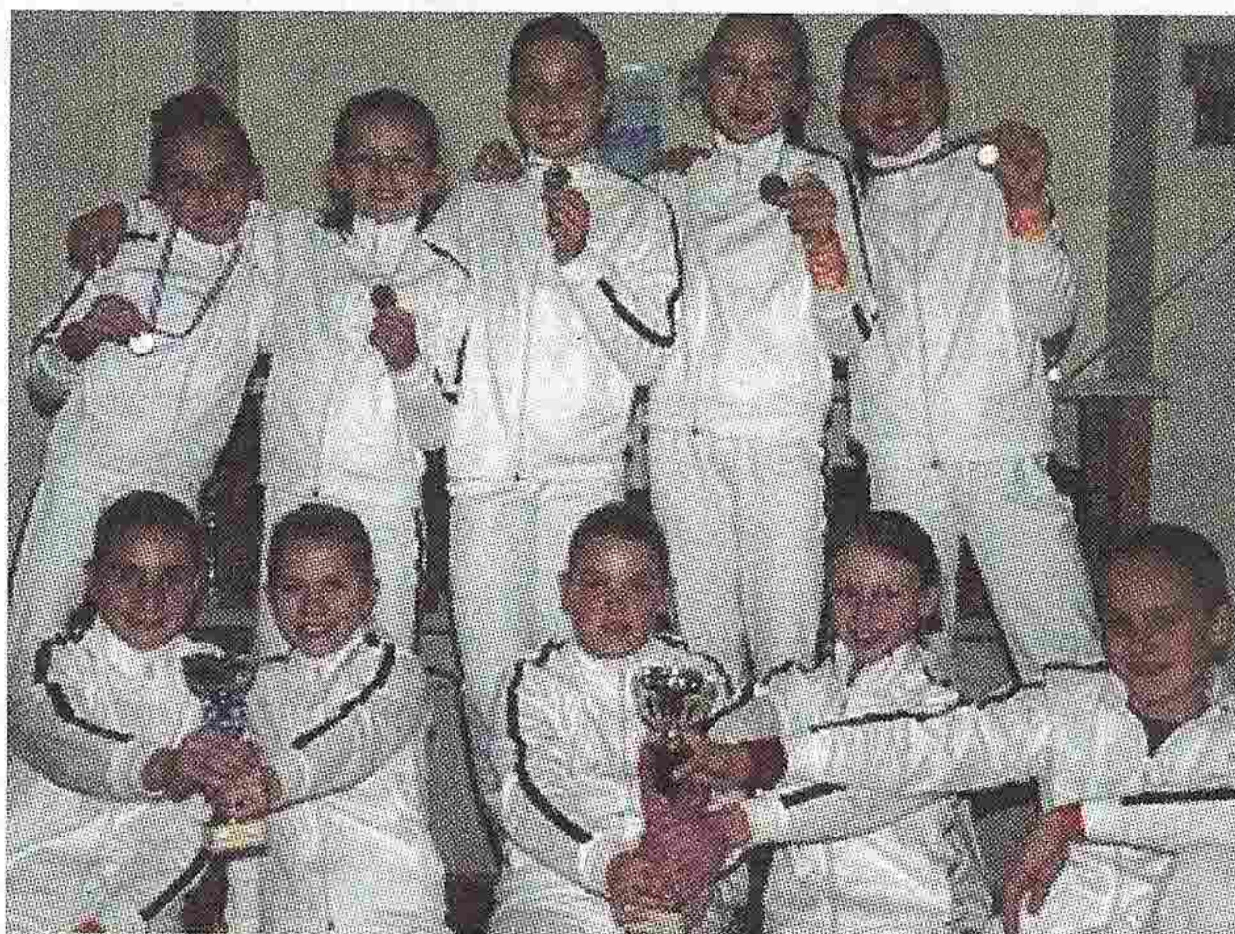
Les gymnastes de Jauzika.